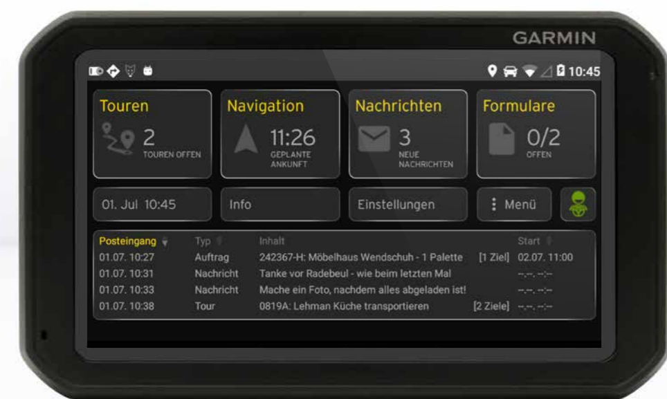
7 Zoll Garmin Display mit der YellowFleetApp.